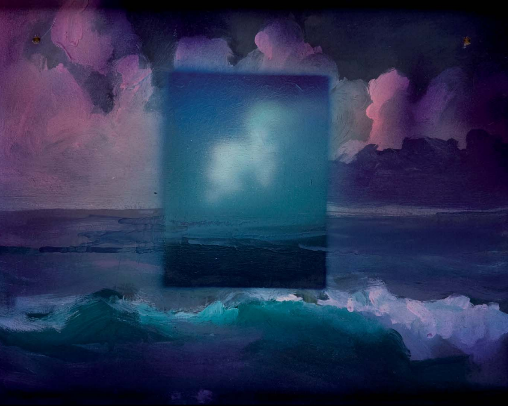
NORONHA DA COSTA