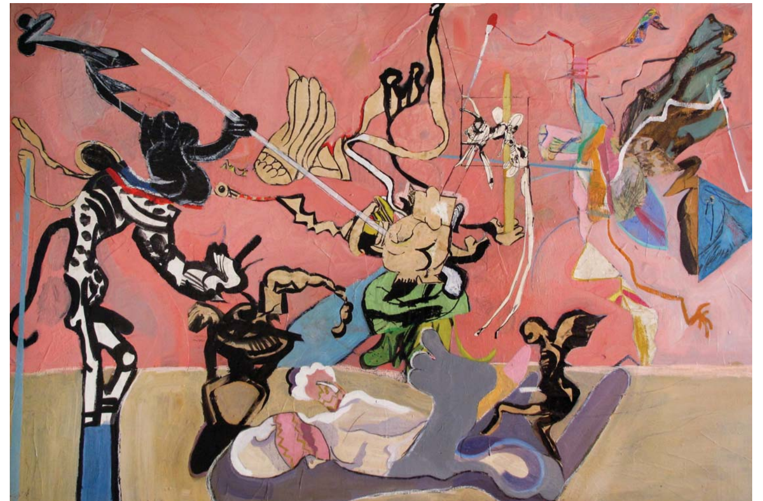
PAULA REGO JÚLIO POMAR

A exposição “Spectrum – Novos funcionamentos artísticos da imagem” resulta de uma frutuosa colaboração entre gAD (Galeria Antiks Design), da Casa Fundação Medeiros e Almeida e do CIEBA (Centro de Investigação e estudos em Belas Artes da Universidade de Lisboa) através da secção de Ciberarte e propõe-se, nas palavras dos seus organizadores, “explorar novos funcionamentos e condições artísticas da imagem”. ►►